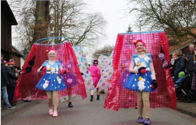
Pattensener Fasiansklub e