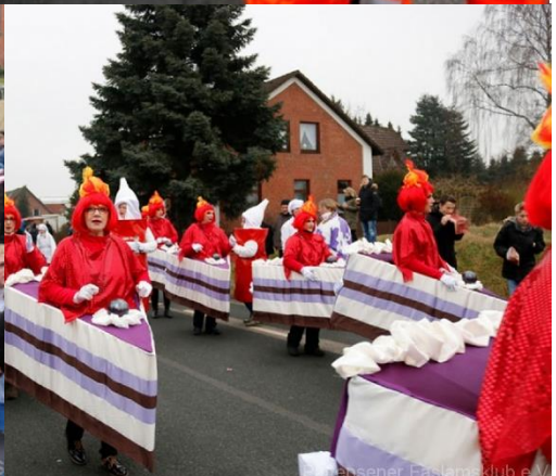
Pattensener Fasiansklub e