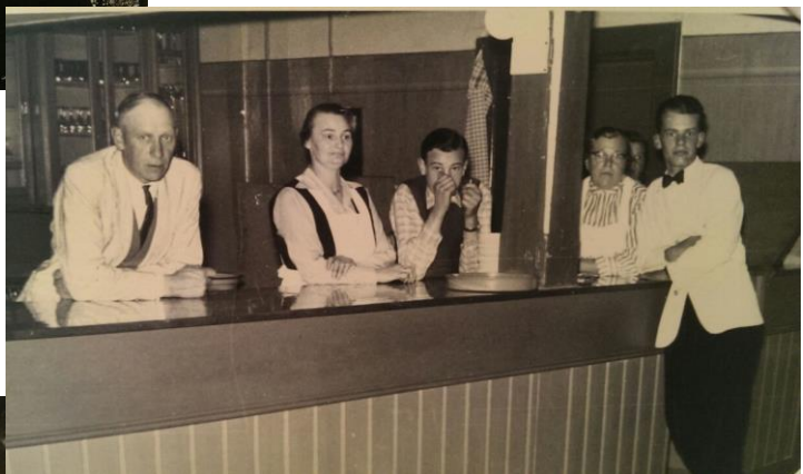
Faslamsfete bei Post-Maack Aufnahmezeitpunkt: 50er Jahren