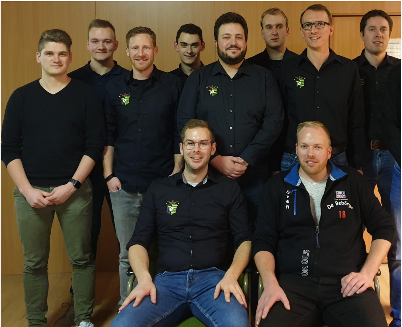
Auf dem Bild fehlen: Felix Jeschke und Tobias Willert