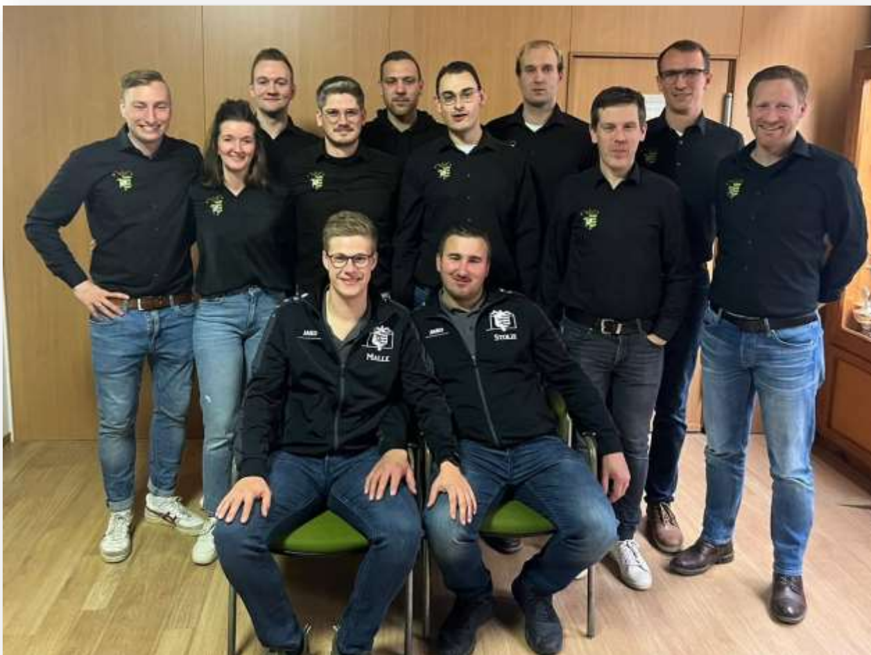
Vorstand 2025 - Es fehlt auf dem Foto: Felix Jeschke